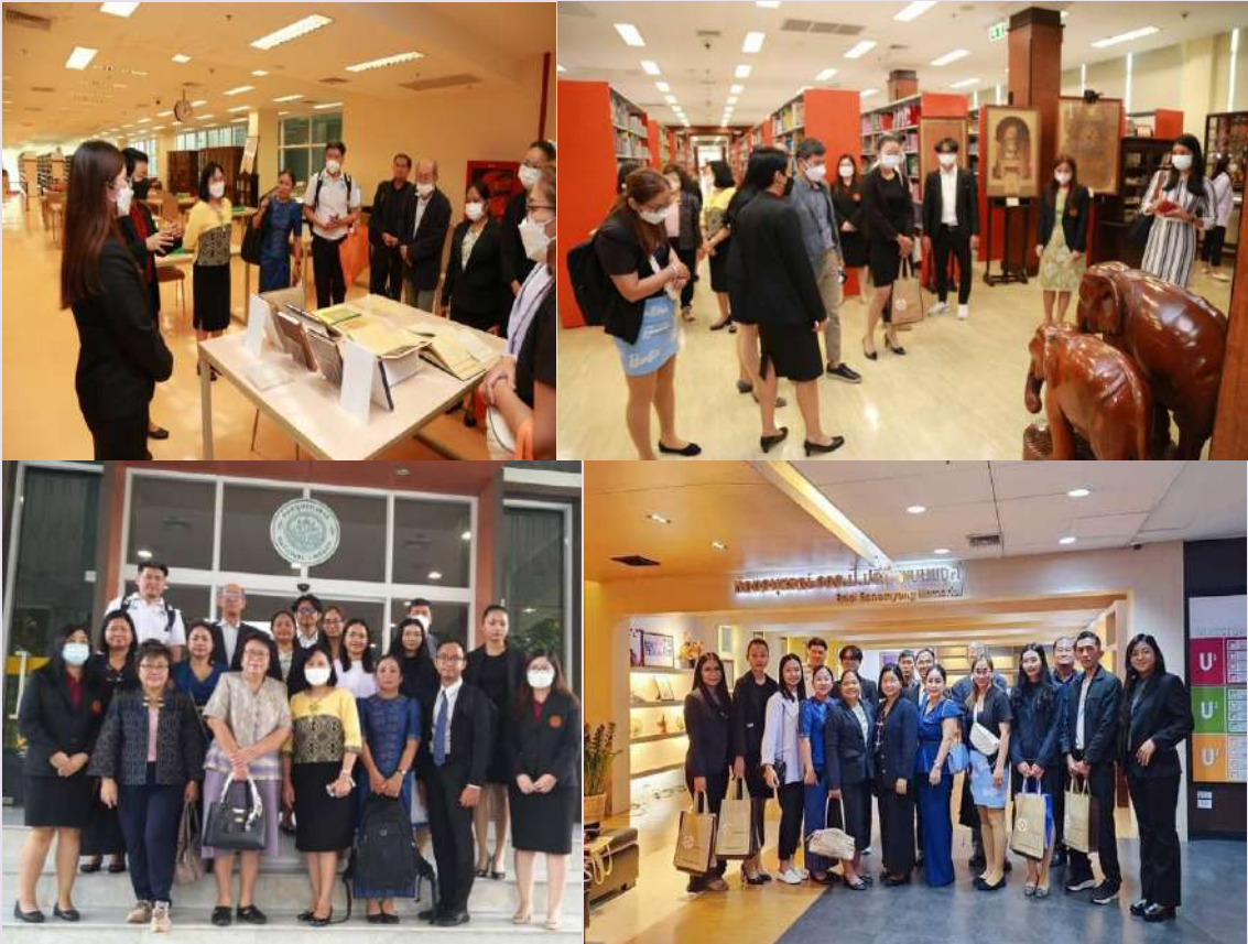
วันที่ 16 มิถุนายน พ.ศ. 2566 เข้าเยี่ยมชมและศึกษาดูงาน ณ สำนักงานวิทยทรัพยากร จุฬาลงกรณ์มหาวิทยาลัย และ ห้องสมุดมารวย ตลาดหลักทรัพย์แห่งประเทศไทย